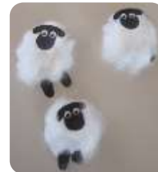
Schafe aus Watte und Tonpapier

Kreativ ist es auch, zur jeweiligen Geschichte eine Seite der Kinderbibel zum Selbstgestalten von Michael Landgraf zu „bearbeiten“.