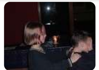
Experimente mit geschlossenen Augen