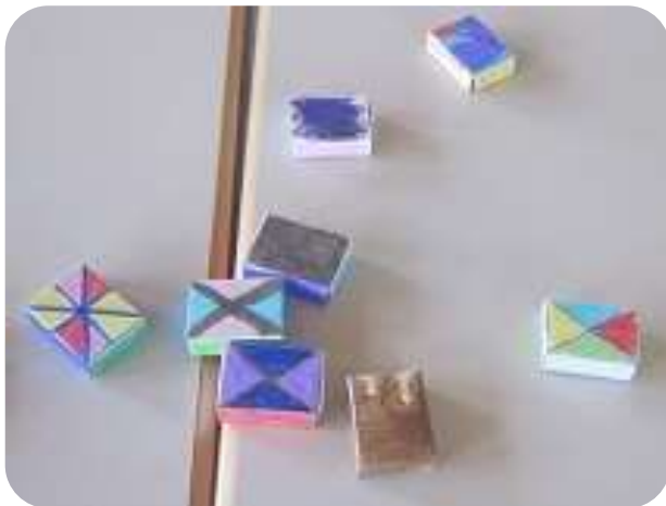
Kleine Schatztruhen basteln