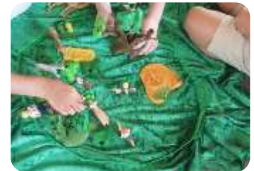
Geschichte mit Figuren nachspielen