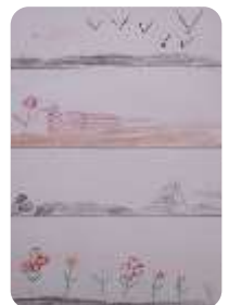
Szenen des Gleichnisses