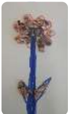
Blume aus Samen