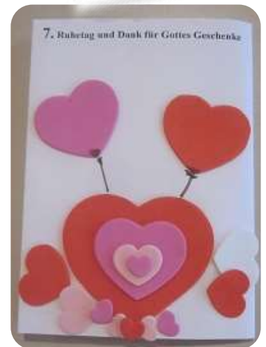
Schöpfungsbuch Tag 7

Zum 3. bis 6. Tag kann man aus selbst trocknendem Ton Figuren und Formen ausstechen oder formen.