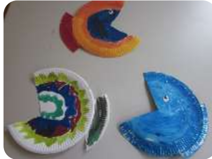
Fische aus Papptellern