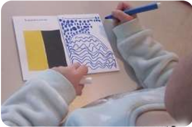
Schöpfungsbuch Tag 1 und 2