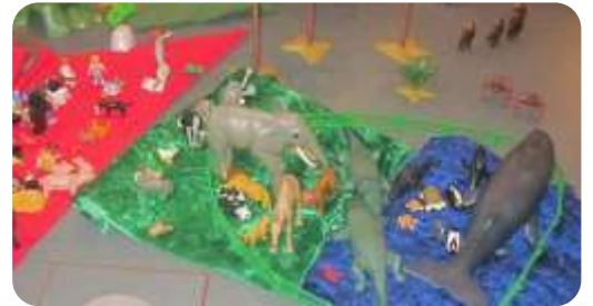
Man kann die Kinder mit Playmobil die Geschichten nachspielen lassen