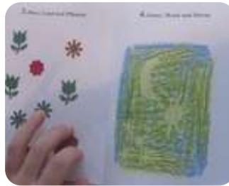
Schöpfungsbuch Tag 3 und 4